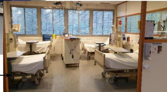
BOX de dialyse à 4 lits

Chaque patient a trois séances de dialyse par semaine, - les lundis mercredis vendredis : le matin, l'après-midi ou le soir - les mardis jeudis samedis : le matin ou l'après-midi.