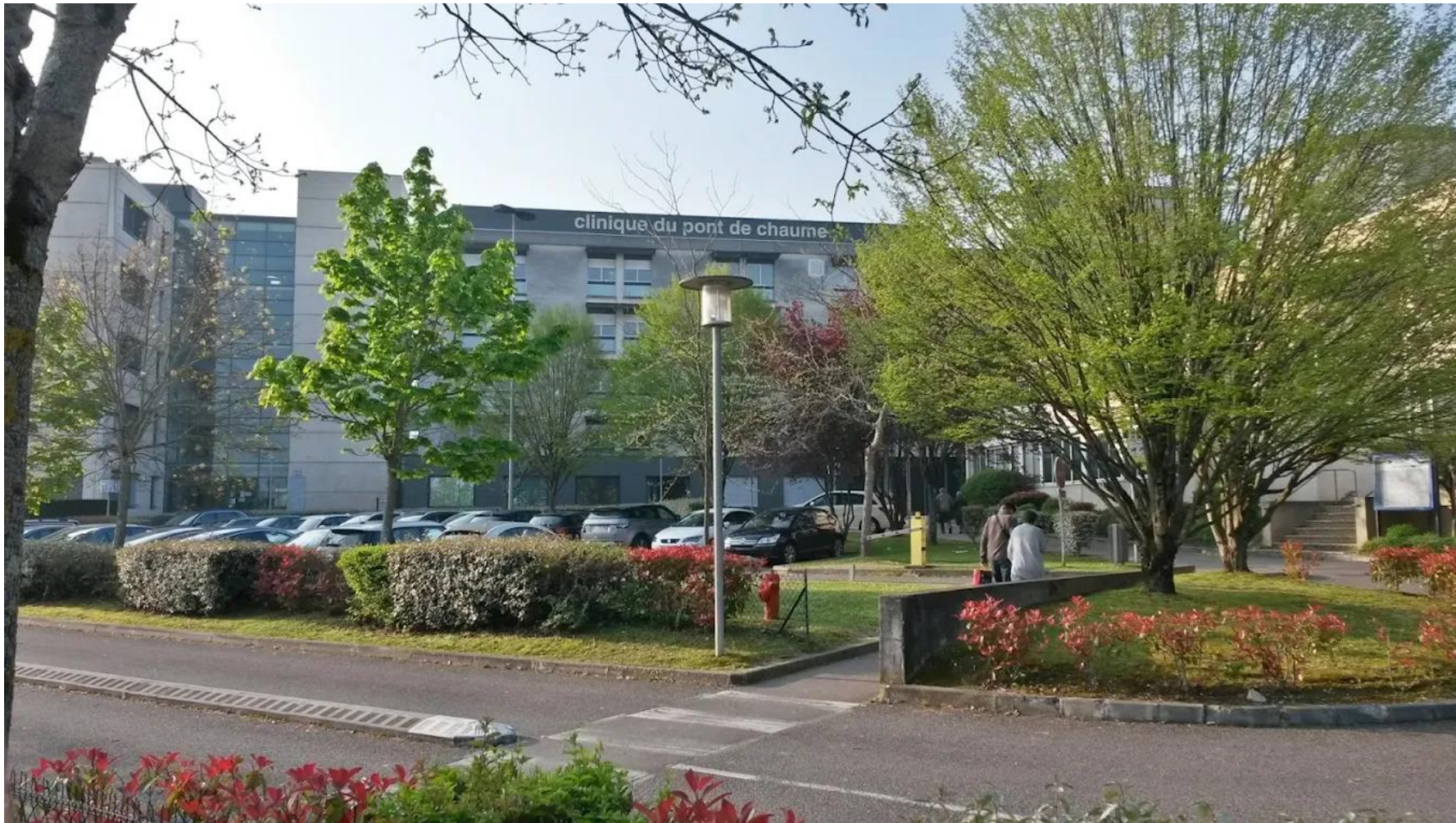
Etablissement privé Médico-Chirurgical groupe ELSAN