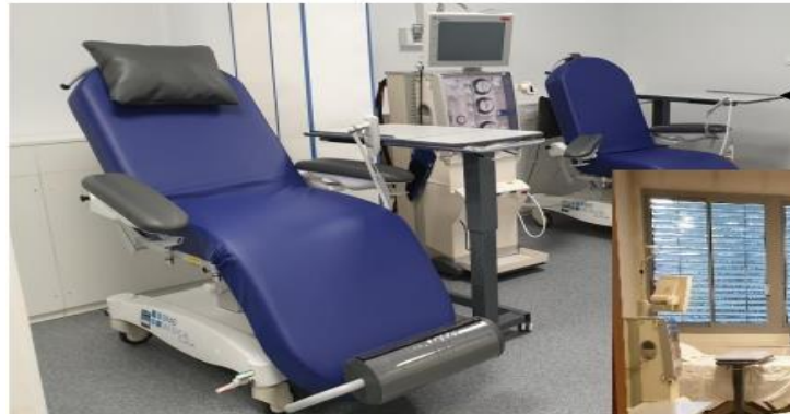
BOX de dialyse à 2 Fauteuils